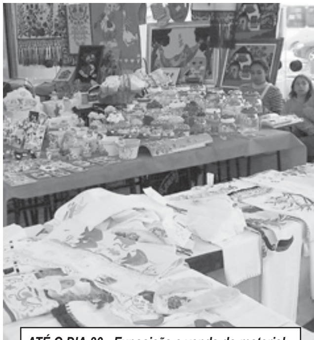
ATÉ O DIA 30 - Exposição e venda do material