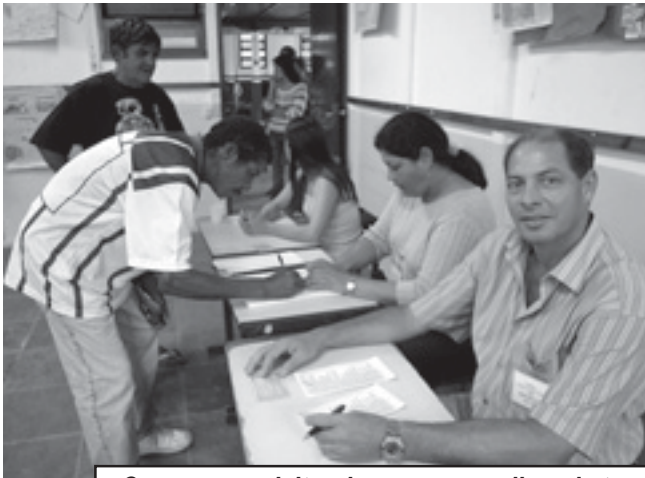
O processo eleitoral ocorreu em clima de tranquilidade na escola Leonor Mendes de Barros