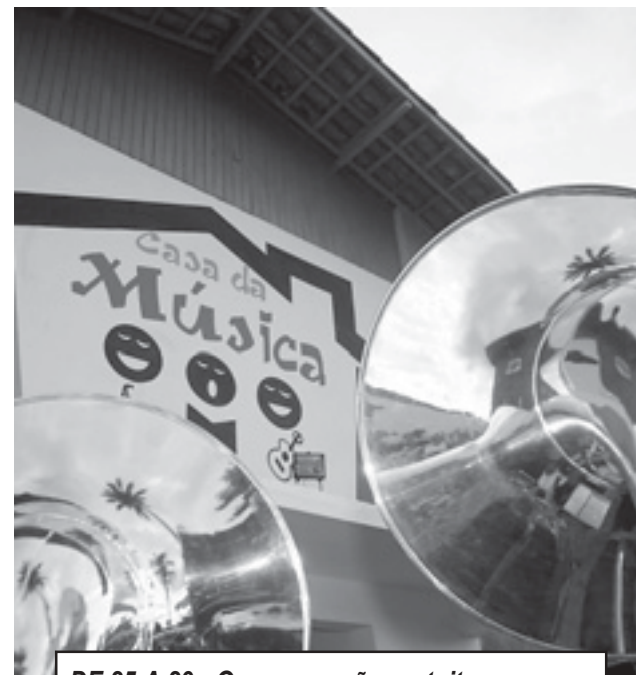
DE 25 A 29 - Os cursos são gratuitos

Para o diretoria de Cultura, a abertura de novas inscrições é uma representação das conquistas da Casa da Música, que surgiu da necessidade de criar condições para o desenvolvimento de um segmento cada vez mais pulsante na Cidade. No local, são oferecidas toda a estrutura