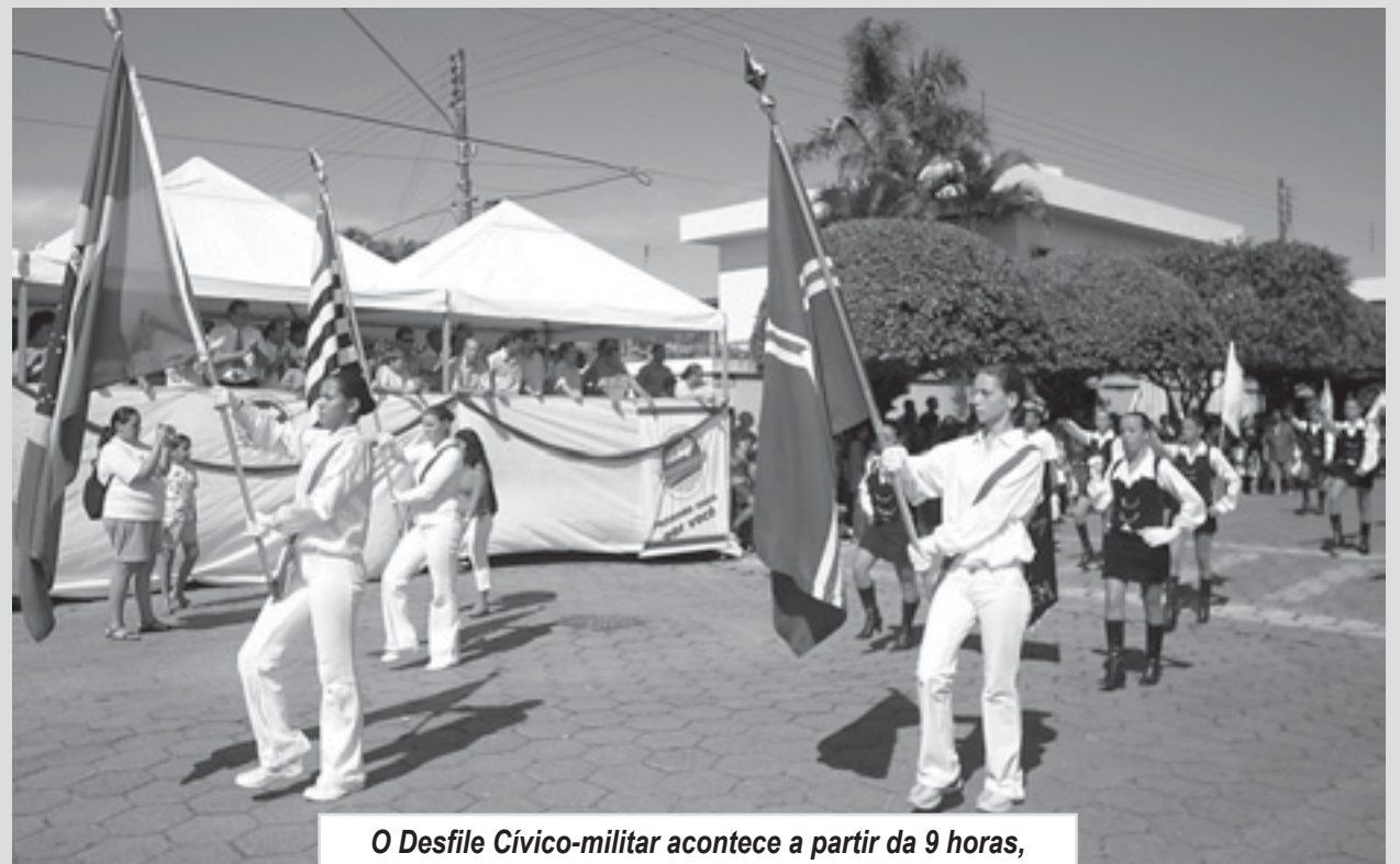
O Desfile Cívico-militar acontece a partir da 9 horas, na Avenida Jaime de Castro (entrada oficial da Cidade)

E, para encerrar a Mostra não poderia faltar a música, produzida pelo Trio Axial. Gerada por máquinas, ela expõe a interação entre a tradição e a tecnologia, que faz com que o músico se relacione com os diversos meios de acesso à democratização cultural.